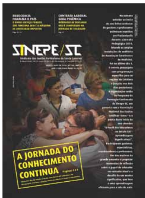
Capa da edição março/abril de 2014