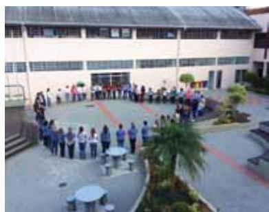
Boas práticas dentro e fora da sala de aula

P ara tratar do tema acima, cerca de 80 professores de várias regiões participaram de jornada em Rio do Sul, no Colégio Sinodal Ruy Barbosa. Em pauta, novas práticas educacionais para crianças de até seis anos.