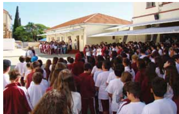
Alunos em momento de reflexão e solidariedade

sa gratidão. Devemos também nos lembrar de tantos outros heróis que, sem poder tomar conta de suas famílias, precisavam salvar moradores ilhados. Eles, os soldados, munidos de barcos e/ou helicópteros – homens que arriscaram suas vidas para salvar as de outrem. A quantos, de alguma forma, prestaram solidariedade aos sobreviventes flagelados da enchente de 1974 em Tubarão, o nosso melhor agradecimento, onde quer que eles estejam e que as asas da eterna gratidão dos tubaronenses socorridos não de alcançá-los estejam onde estiverem". (Com informações de Mariana May D'Alascio, da comunicação do CSJ)