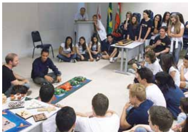
Novo paradigma estimula novas competências e habilidades