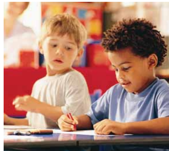
Para ter sucesso é importante desafiar o senso comum

Palavras do jornalista e escritor canadense Malcolm Gladwell, colaborador da prestigiada revista americana New Yorker . Ele já vendeu 10 milhões de exemplares em mais de 30 idiomas. Seu último livro, Davi e Golias , lançado nos Estados Unidos está no topo da lista de não ficção mais vendido do jornal The New York Times . Em entrevista ao jornalista Lucas Rossi, de Exame (17/3/14) diz que as adversidades e as deficiências podem ser um ótimo empurrão para que pessoas — e também países e empresas — sejam bem-sucedidas. Leia a íntegra da transcrição em www.sinepe-sc.org.br