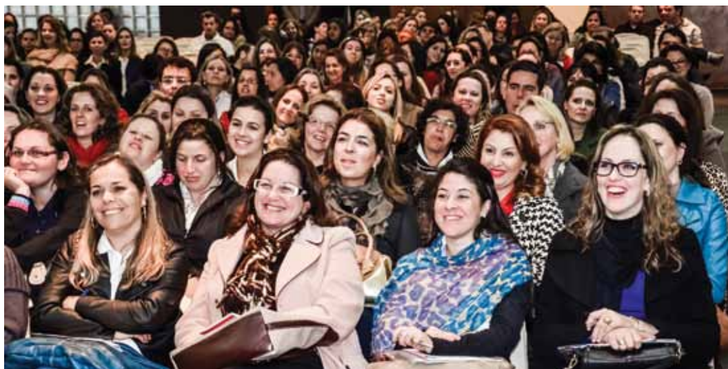
II Jornada 2013: satisfação com os desafios e as novas competências que se impõem a cada instante