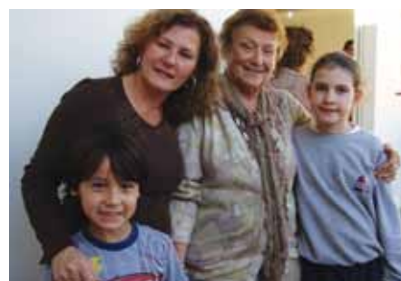
A reverência do amor na família

4/7 Dia Internacional do Cooperativismo.