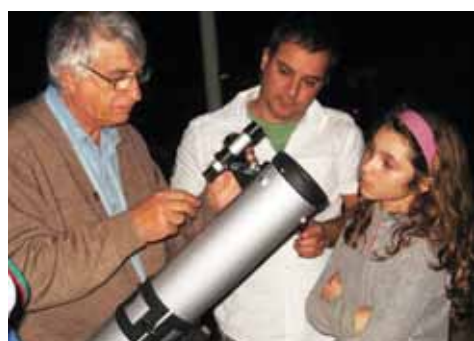
Uma noite com emoções e descobertas

14/6 Festa Junina - (Muito mais do que a diversão, nossa Festa Junina visa fortalecer os aspectos populares da cultura brasileira, além de propiciar à comunidade escolar espaço para agir e confraternizar coletivamente. É preparada e realizada em conjunto, pelas famílias e pelos trabalhadores da Escola. Durante os festejos acontecem as apresentações dos estudantes, a nossa "quadrilha democrática" (feita sem ensaio e com a participação de todos os presentes), forró e muita comilança gostosa).