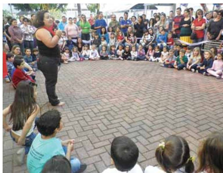
Quem tem sabedoria popular vai mais longe