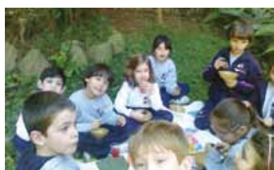
Formação integral do Infantil ao Ensino Fundamental